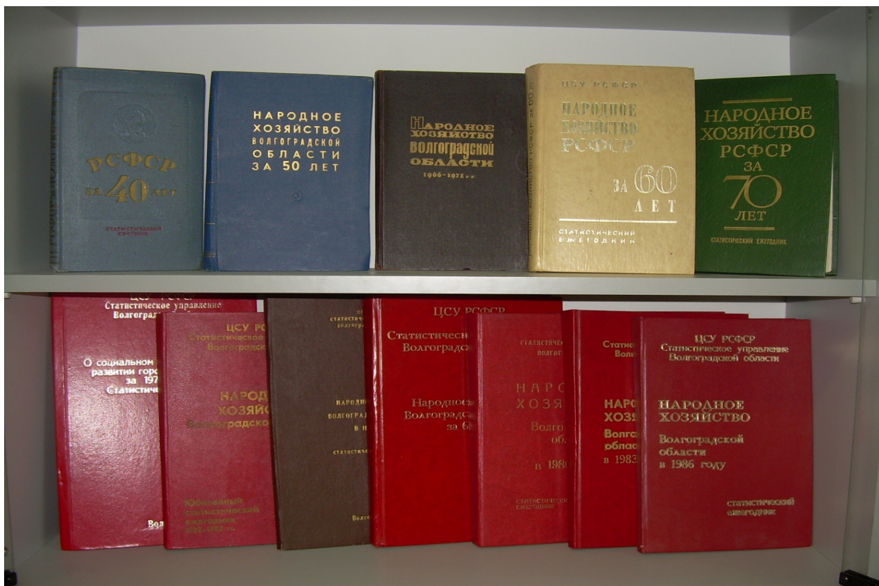
Статистические сборники «Народное хозяйство Волгоградской области», изданные в разные годы, начиная с 1967 г.

В музее хранятся статистические сборники, изданные органами статистики Волгоградской области, отражающие все стороны экономики и развития области с 30-х годов прошлого столетия по настоящее время.