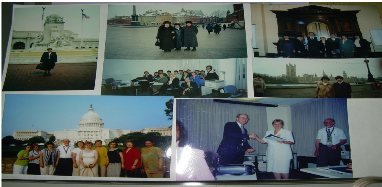
Участие сотрудников Волгоградстата в обучении за рубежом в 2001-2002 гг.

Волгоградстат сегодня – это уникальный, не знающий аналогов информационный банк данных, имеющий обширные фонды статистической информации о социально-экономическом положении Волгоградской области. В нем трудится большой, сплоченный, грамотный коллектив. Многие из сотрудников неоднократно повышали свою квалификацию на семинарах в различных странах мира. Статьи о работе Волгоградстата и его сотрудниках опубликованы в научно-популярном альбоме «Волгоградская область – 2001», сборнике «Женщины Волгограда – 2003».