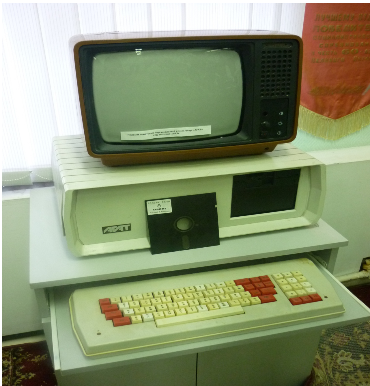
Персональный компьютер АГАТ 1983 года выпуска

Впервые за историю существования органов статистики 11 декабря 2008 г. в Волгоградстате отмечался День молодого статистика. Говорят, чтобы лучше понять народ, надо познакомиться с его историей, а вот чтобы постигнуть суть профессии, нужно проследить путь ее развития и оценить вклад, который она внесла в формирование общества. Поэтому праздник для молодежи начался экскурсией в музей Волгоградстата, где все пропитано духом истории, а собранные документы повествуют о самоотверженном труде, беззаветном служении своему профессиональному долгу десятков и сотен статистиков.