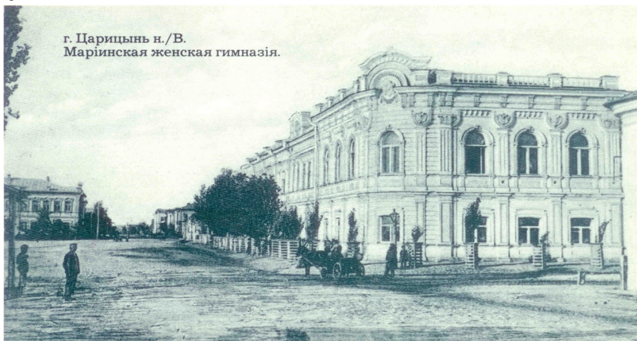
г. Царицын. Здание Первой Мариинской женской гимназии. Фото до 1917 г. В настоящее время здание Волгоградстата - памятник истории и культуры регионального значения

В 2004 г., в честь 85-летия Волгоградской статистики, был основан музей истории Волгоградстата. Экспозицию составляют уникальные исторические документы, отражающие историю царицынской-сталинградской-волгоградской статистики с 1919 г. по настоящее время.