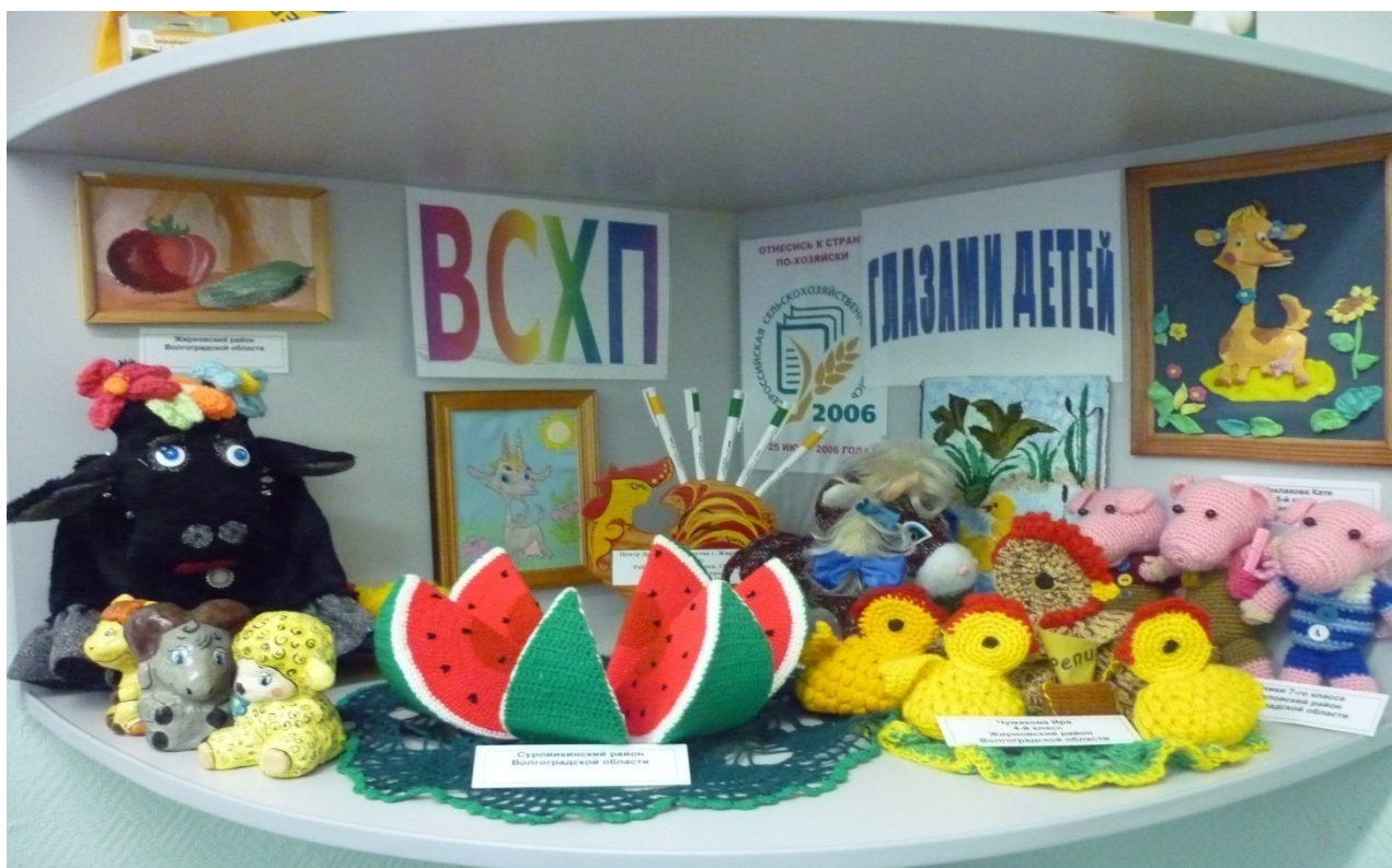
Детские работы, посвященные Всероссийской сельскохозяйственной переписи 2006 г.

Имеется раздел, посвященный Всероссийской переписи населения 2002 г. и Всероссийской сельскохозяйственной переписи 2006 г., в котором представлены документы, отражающие подготовку, проведение этих крупномасштабных работ и их первые результаты. В музее размещена лучшая часть детских рисунков и поделок, посвященных Всероссийской сельскохозяйственной переписи 2006 г.