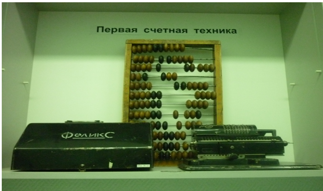
Счетная машинка «ФЕЛИКС» год выпуска 1932

В музее хранятся статистические сборники, изданные органами статистики Волгоградской области, отражающие все стороны экономики и развития области с 30-х годов прошлого столетия по настоящее время.